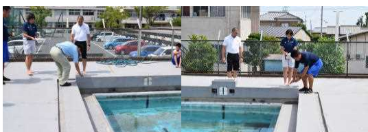
プールの安全を祈って 盛り塩と清酒で清めました