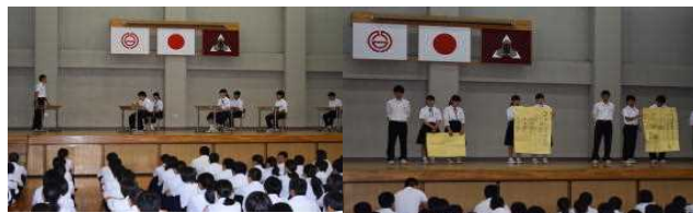
生活委員による挨拶と服装の劇 3年生による質問等を行いました