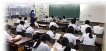
第1回体育祭実行委員

体育祭については、体育委員・学級委員を中心に実行委員を組織され活動が始まっています。また、東雲祭は合唱曲が以下のように決まり、現在練習が進んでいます。東雲祭は、学年ごとの開催で、お子さんのいる学年は参観可能ですので、ぜひお越しください。（1年・13:00～、2年・14:00～、3年・15:00～）