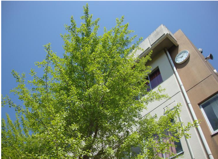
体育館前の新緑のイチョウ 5月10日撮影

人権とは、誰もが生まれながらにして持っている、人が人らしく生きていくための権利で、誰からも侵されることのない基本的な権利です。そして、人権を尊重するとは、 相手のことを自分のことと同じように考え、大切にすることです。そして、思いやりの心をもって、お互いの違いや多様性を認め合うことです。その結果、誰もが幸せに暮らしていける社会が創られます。