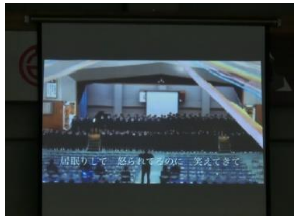
卒業生の合唱風景 3月8日撮影

人と人との関わり方、うまくいている時は、いいのですが……。仲間との関わり方とても難しいものです。なんで簡単にうまくいかないのでしょうか。