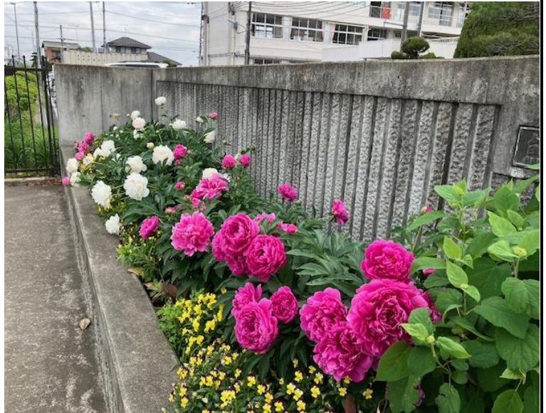
正門脇のシャクヤク 5月8日撮影

そして、年齢を重ねていくにつれ、どんどん自分の都合のいいように解釈してしまう傾向があるそうです。